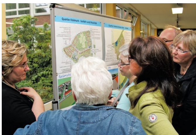
Abb. 5: Dialog zwischen Bürgern und Fachleuten zum Quartier Ostpark-Bochum

Die Ergebnisse der Bürgerbeteiligung waren Grundlage für die in der Planung des Ostparks integrierten Anpassungsmaßnahmen. Im Mittelpunkt stand zum einen die Freiraumgestaltung: