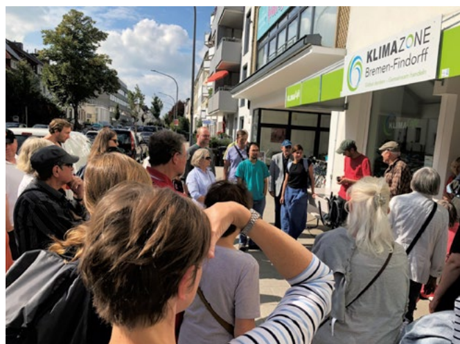
Abb. 2: KlimaCafé als zentrale Anlaufstelle im Quartier für Veranstaltungen und neue Ideen

in der Woche als Nachbarschaftstreff ein. Bürgerinnen und Bürger können bei Kaffee und Kuchen ins Gespräch kommen, neue Ideen entwickeln und Aktionen planen. Das KlimaCafé wird von Freiwilligen aus dem Quartier betreut. Themen in der Klimazone reichen von energiesparendem Wohnen und autofreier Mobilität bis hin zu Müllvermeidung und Kleidertauschbörsen. Aber auch Maßnahmen der Hitzeanpassung werden bearbeitet. Zum einen sollen Entsiegelungs- und Begrünungsprojekte helfen, die zunehmende Hitzebelastung in Findorff zu mindern. Zum anderen werden Fassaden- und Dachbegrünungen umgesetzt. Die Stadtteilbewohner werden dabei von Fachleuten und Organisationen begleitet. Experten aus der Umweltberatung zeigen beispielsweise auf, wo Maßnahmen durchgeführt werden können oder geben Tipps zur Pflanzenwahl und Pflege. Bei Entsiegelungen beteiligt sich der Bremer Senator für Umwelt, Bau und Verkehr, indem er großflächige Vorhaben finanziell bezuschusst. (Vgl. Klimazone Bremen Findorff 2019)