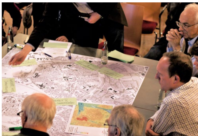
Abb. 4: Workshops zur Klimaanpassungsstrategie Soest

Wohnblöcke verdichtet oder Luftleitbahnen beeinträchtigt werden. Der Druck auf dem Wohnungsmarkt und die Ziele der Klimaanpassung scheinen nur schwer vereinbar. Die Stadt Bochum strebt deshalb an, durch innovative Stadtplanung lebenswerten Wohnraum zu schaffen und gleichzeitig Hitzebelastung zu mindern. 2011 begann die Planung des nachhaltigen Wohnungsbauprojektes Ostpark-Bochum. Auf einem 13 Hektar großen Areal am östlichen Stadtrand sollen schrittweise über 1.100 Wohneinheiten entstehen. Das Gebiet ist zudem mit einer 12 Hektar großen Grünfläche verbunden. Zahlreiche Maßnahmen der Klimaanpassung wurden in die Planung integriert. Dazu hatten Bürgerinnen und Bürger zwischen 2014 und 2015 die Möglichkeit, sich intensiv am Planungsprozess zu beteiligen. In Workshops, Diskussionsrunden und Entwurfswerkstätten sammelte die Bevölkerung Ideen und Anregungen. Die Bürger hatten dadurch einen Überblick über den aktuellen Planungsstand und konnten selbst Einfluss auf das neue Quartier nehmen (Abb. 5).