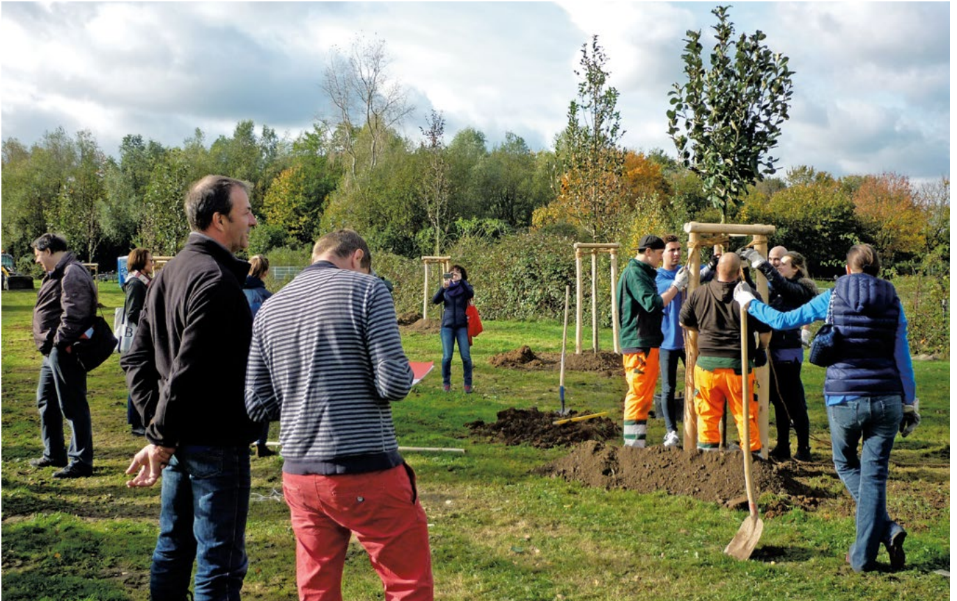
Abb. 3: Gemeinschaftliche Gestaltung des „Klimaparks“ in Bilderstöckchen

das Konzept eines „Klimaparks“ gemeinschaftlich entwickelt. Eine brachliegende und teilweise verwilderte Fläche gestalteten die Bewohnerinnen und Bewohner in einen naturnahen Park um (Abb. 3). Das Projektteam aus engagierten Bürgern wurde durch Mitarbeiter des Kölner Grünflächenamtes und der Ford Werke GmbH unterstützt. „Gemeinsam fürs Klima in Bilderstöckchen“ zeigt, wie Bewohner, Stadtverwaltung sowie lokale Unternehmen und Vereine gemeinsam Klimaanpassungsmaßnahmen umsetzen können. (Vgl. Initiative „Unternehmen - engagiert in Köln“ 2018, Klimapark Köln 2019)